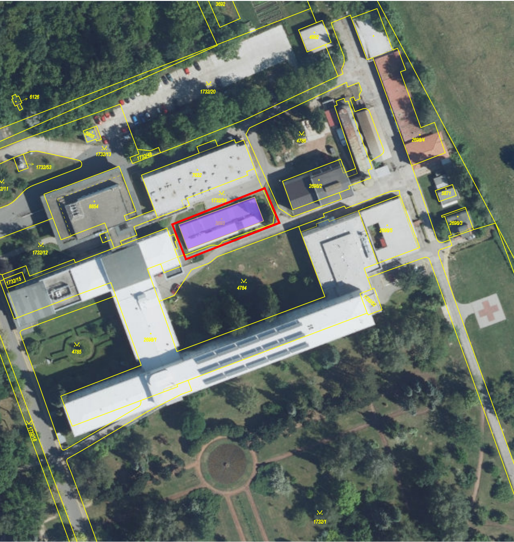
SITUACE ORTO FOTO